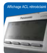
Affichage ACL rétroéclairé

Les téléphones IP de la série KX-NT300 vous feront découvrir une nouvelle dimension sur les plans du rendu sonore, de la productivité dans les communications, de la connectivité réseau à large bande et du service à la clientèle. Les téléphones IP de Panasonic vous permettent de bénéficier facilement de tous les avantages des systèmes de communication NCP et, en particulier, d'un accès rapide à toute la gamme d'applications et de fonctions évoluées.