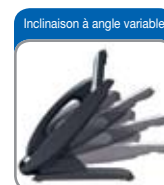
Inclinaison à angle variable